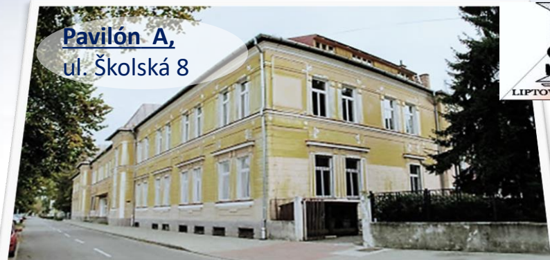
Pavilón A, ul. Školská 8