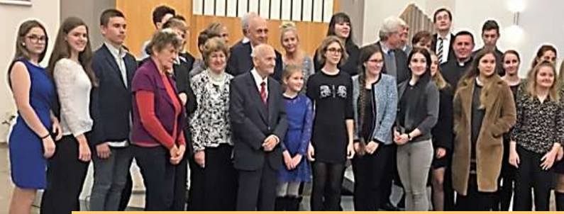
Účastníci súťaže - Mládež a odkaz A. Dubčeka, Bratislavský hrad, november 2019