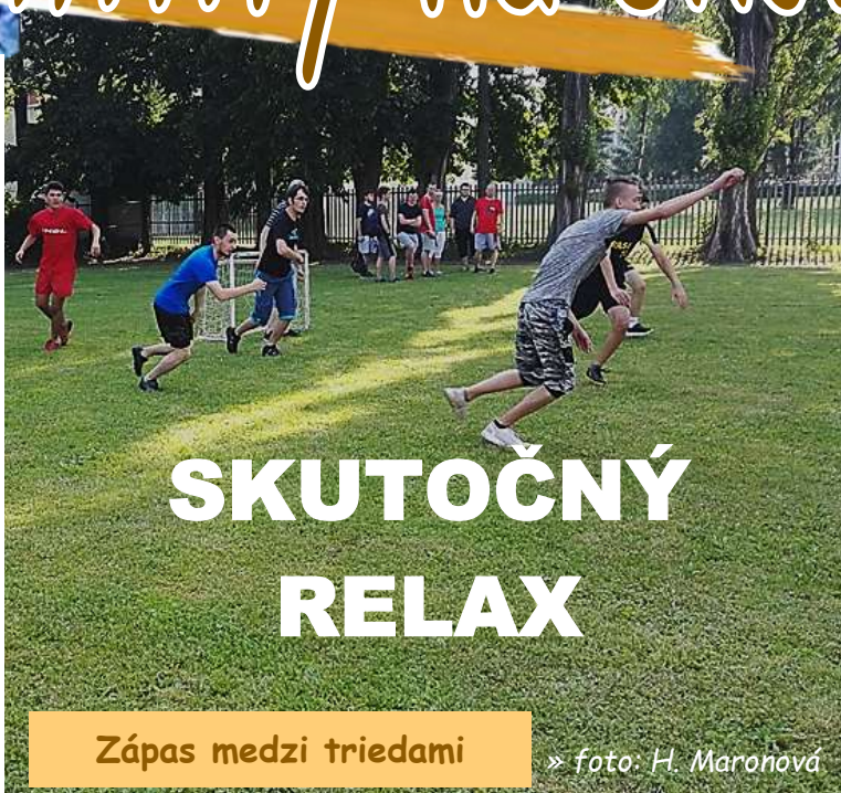
Zápas medzi triedami

Na stavebnej v Liptovskom Mikuláši je pohybu až dosť. Príde si každý na svoje pretože škola okrem učenia plne žije aj športom.