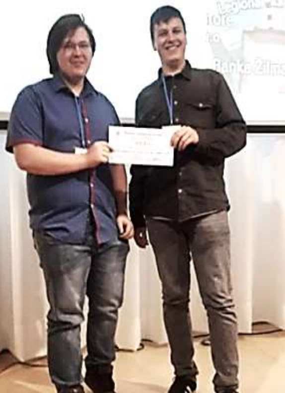
Stredoškolský podnikateľský zámer Žilina 2019